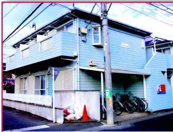
* 図面と現況が異なる場合は現況を優先とさせていただきます。